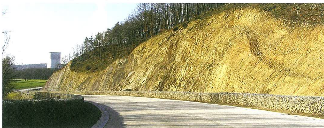
La montée depuis Tihange est pratiquement opérationnelle, puis s'arrête en plein bois.